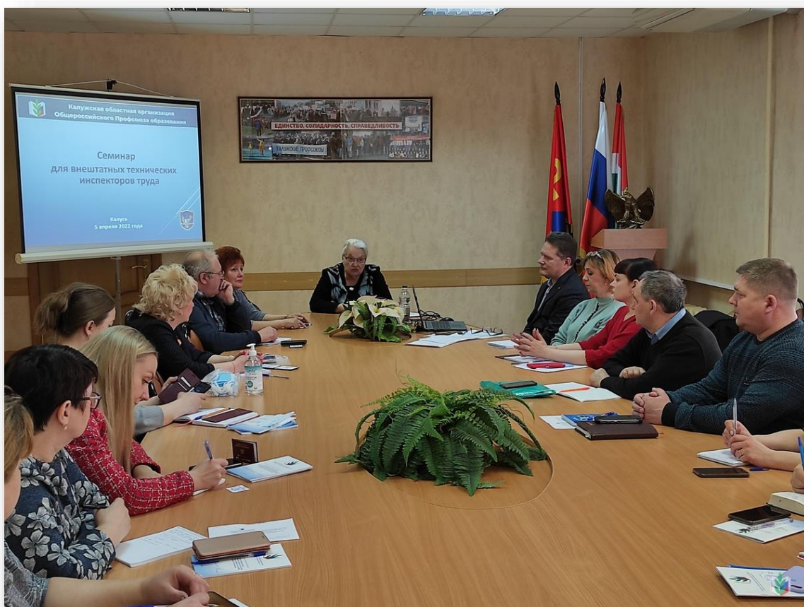
Обучающий семинар с участием внештатных технических инспекторов труда

5 апреля 2022 года проведён обучающий семинар с участием внештатных технических инспекторов труда. В работе семинара приняли участие представители всех территориальных профсоюзных организаций Калужской области. Основными вопросами семинара были правовые основы, цели и задачи деятельности технической инспекции труда, выполнение мероприятий по охране труда в образовательных организациях, практические вопросы проверок внештатным техническим инспектором. Участники получили удостоверения о проверке знаний требований охраны труда и удостоверения внештатных технических инспекторов труда.